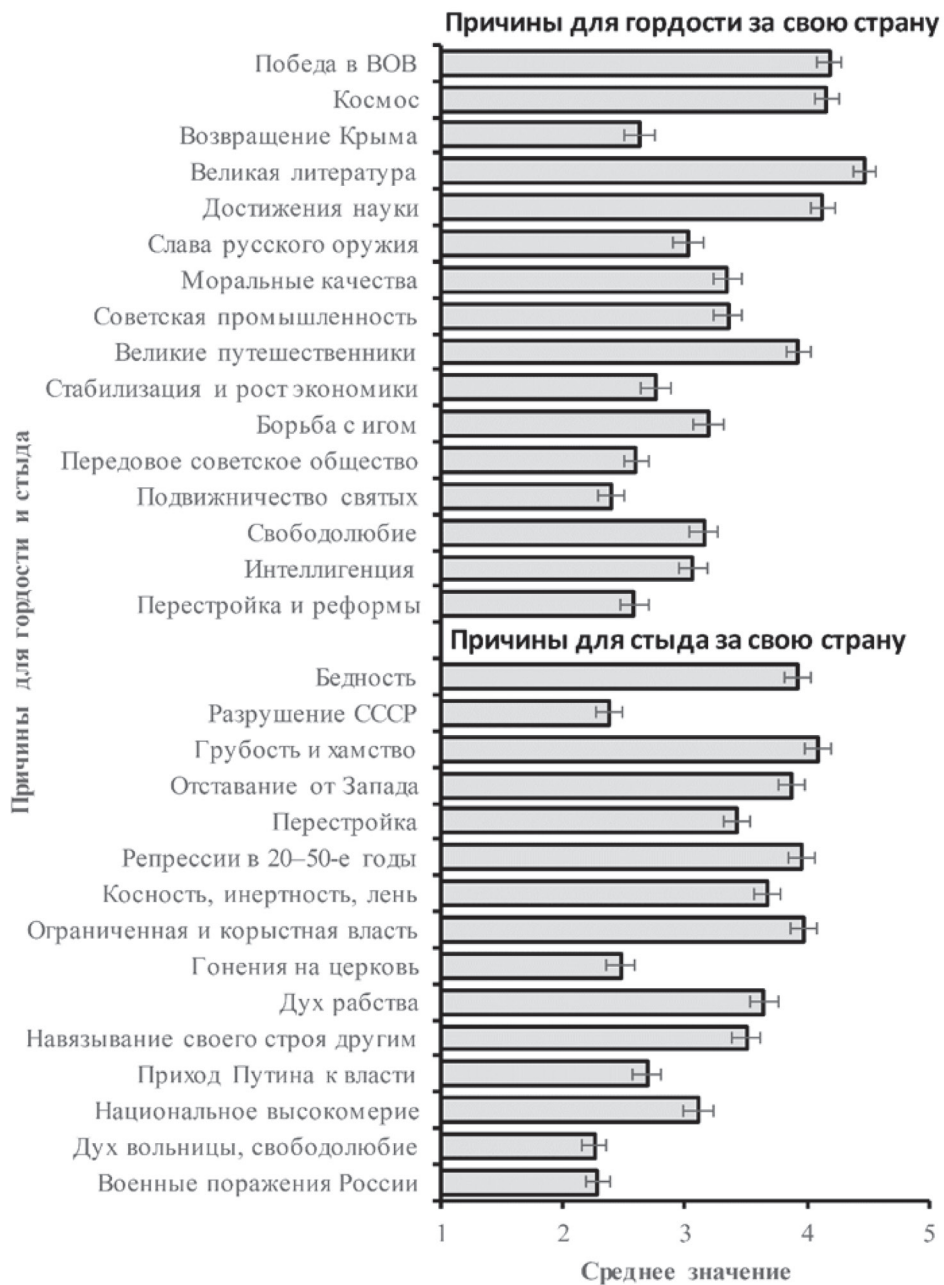
Рис. 1. Средние оценки причин для гордости и стыда за свою страну: горизонтальные отрезки указывают на границы 95%-ного доверительного интервала, полные формулировки причин см. в табл. 1 и 2