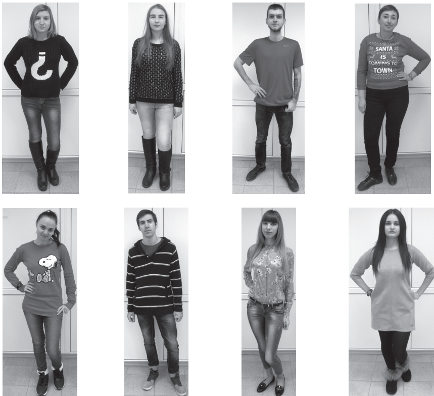
Рис. 2. Набор фотоизображений из комплекта № 2 (в верхнем ряду справа — возрастная модель)

Результаты исследования с использованием данного комплекта [12] показали значимые различия в воспринимаемом возрасте моделей, представленных на фото или видео. Обнаружена следующая закономерность: если динамический компонент внешнего облика человека доступен для оценки его возраста, то он воспринимается другими как более молодой, чем тогда, когда представлен только на фото. При этом оценки возраста моделей, полученные на основании фото- и виде-