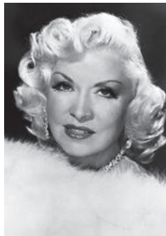
Фотография 6 — 64 года