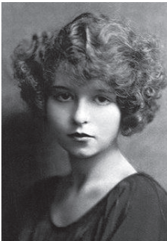
Фотография 1 — 17 лет

Фотографии предъявляются испытуемым в случайном порядке. Испытуемый оценивает возраст модели, а также измеряется его отношение к модели с использованием «Цветового теста от-