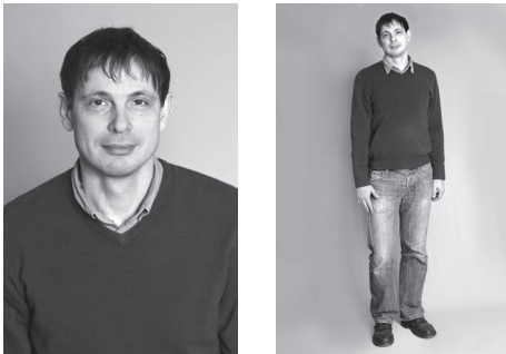
Рис. 1. Пример портретной и ростовой фотографии из комплекта № 1

На основании вышеизложенного нами разработана процедура фотовидеопрезентации внешнего облика, которая включает в себя четыре разных комплекта фото- и видеопрезентаций внешнего облика. В комплект № 1 входит набор фотографий для анализа компонентов внешнего облика в структуре восприятия возраста. Для создания комплекта были сфотографированы люди различных возрастов, профессий и типажей (профессиональная фотосъемка с правильно подобранным светом, единообразным фоном, но без применения технологий «фотошоп»). В комплект включены 40 фотографий, отвечающих следующим требованиям: по 2 женские и мужские портретные и ростовые фотографии из каждого десятилетия начиная с 1950 года рождения и заканчивая 1999-м (т. е. на одно десятилетие приходится 4 человека и 8 фото). Фотографии помещены в альбом таким образом, чтобы испытуемый мог видеть только одно фото и не переходил к следующему, не оценив предыдущего, при этом сначала показывается карточка с ростовым изображением человека, затем — с портретным.