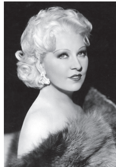
Фотография 3 — 41 год