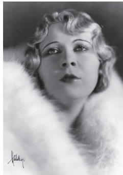
Фотография 2 — 27 лет