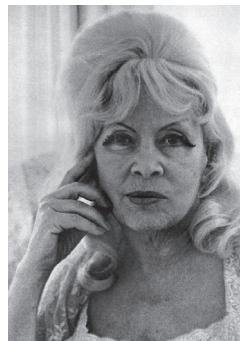
Фотография 7 — 72 года