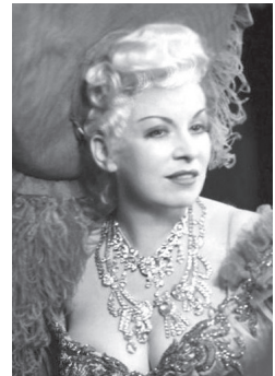
Фотография 4 — 50 лет