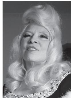
Фотография 8 — 80 лет