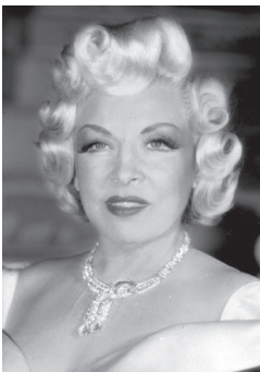
Фотография 5 — 57 лет