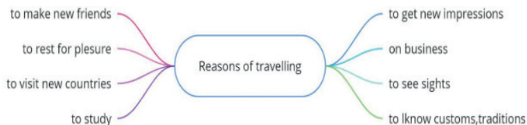
Рис. 1. Ментальная карта

Compare different ways of travelling. Use the adjectives in the boxes (рис.2).